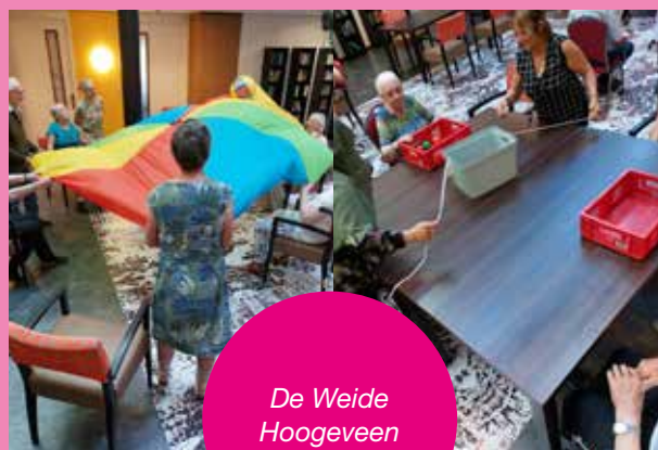
De Weide Hoogeveen