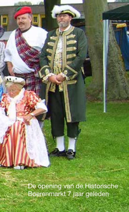
De opening van de Historische Boerenmarkt 7 jaar geleden