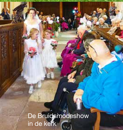
De Bruidsmodeshow in de kerk