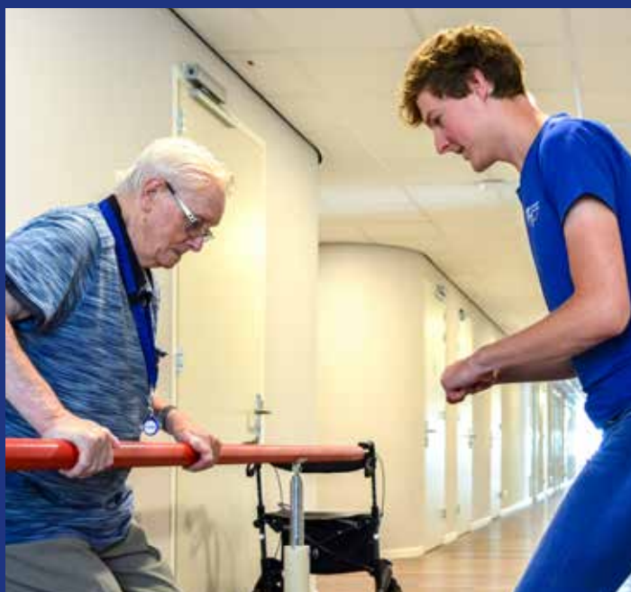
Fysiotherapie is vaak een dagelijks onderdeel voor cliënten

het Herstelhotel op zorgkaart Nederland met het hoge cijfer 8,5! We zijn dan ook trots op het hebben van deze mooie voorziening, het deskundige multidisciplinaire team en de vele vrijwilligers! De komende tijd zal het Herstelhotel zich doorontwikkelen, waardoor nog meer mensen niet opgenomen hoeven worden in een ziekenhuis, maar hoogwaardige (complexe) zorg ontvangen in een voor hun passende tijdelijke omgeving. We gaan door!