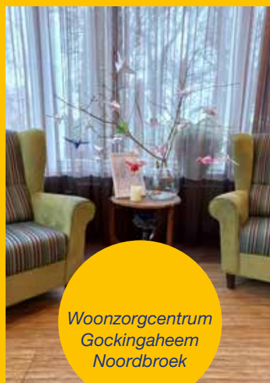
Woonzorgcentrum Gockingaheem Noordbroek