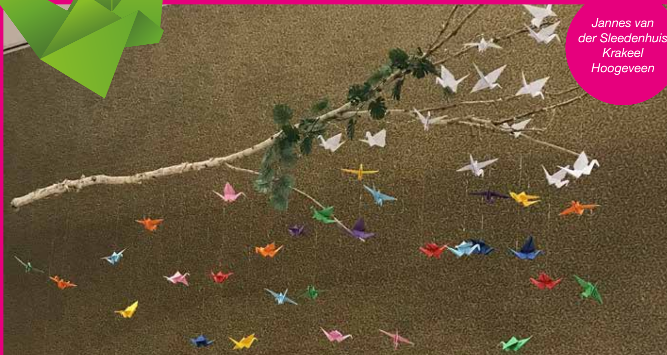
Jannes van der Sleedenhuis Krakeel Hoogeveen