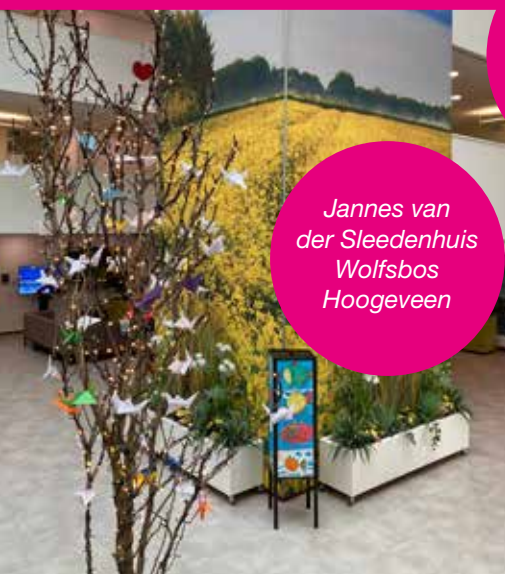
Jannes van der Sleedenhuis Wolfsbos Hoogeveen