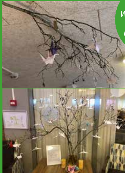
Woonzorgcentrum Beatrix Hollandscheveld