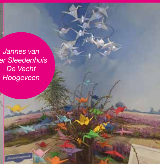
Jannes van der Sleedenhuis De Vecht Hoogeveen