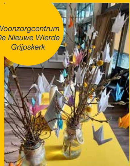
Woonzorgcentrum De Nieuwe Wierde Grijpskerk