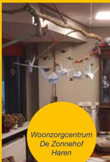
Woonzorgcentrum De Zonnehof Haren