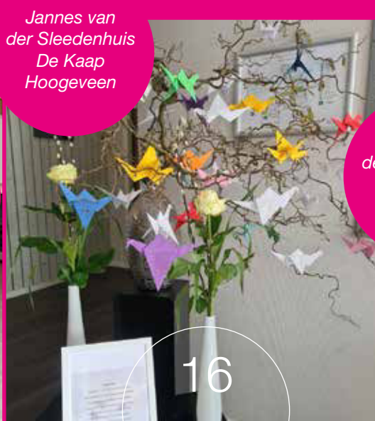
Jannes van der Sleedenhuis De Kaap Hoogeveen