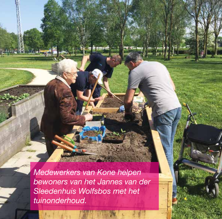
Medewerkers van Kone helpen bewoners van het Jannes van der Sleedehuis Wolfsbos met het tuinonderhoud.