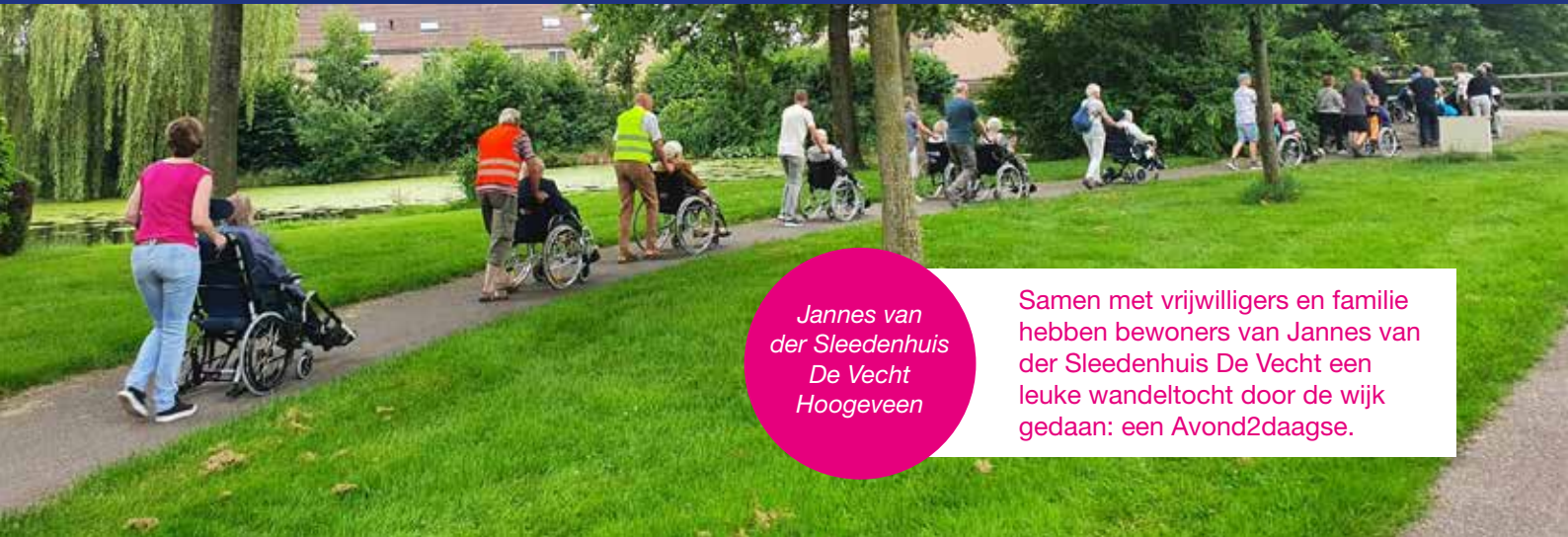
Jannes van der Sleedenhuis De Vecht Hoogeveen

Samen met vrijwilligers en familie hebben bewoners van Jannes van der Sleedenhuis De Vecht een leuke wandeltocht door de wijk gedaan: een Avond2daagse.