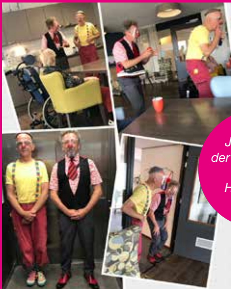
Jannes van der Sleedenhuis Krakeel Hoogeveen

Visiteclowns brengen een bezoek aan het Jannes van der Sleedenhuis Krakeel: twee professionele clowns gaven de bewoners via de inzet van mimiek, zang, beweging, geluid en humor, een verrassend en ontroerend stuk persoonlijke aandacht in een ontspannen sfeer.