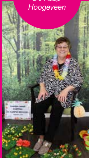
Jannes van der Sleedenhuis De Kaap Hoogeveen

Bij Jannes van der Sleedenhuis De Kaap werd in augustus camping "de Kaapse Heuvelen" twee weken geopend voor de bewoners. Zo konden er vakantie-foto's gemaakt worden bij de tent. Er waren veel gezellige contacten, ook bewoners van aangrenzende flats kwamen even een kijkje nemen op de camping.