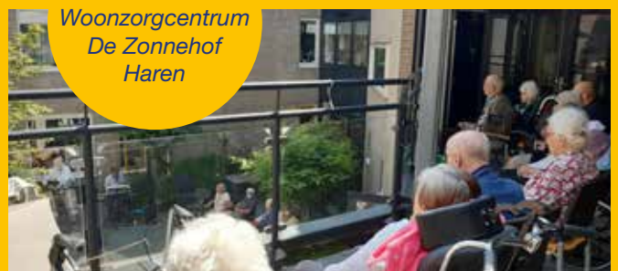
Woonzorgcentrum De Zonnehof Haren