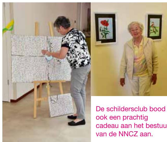
De schildersclub bood ook een prachtig cadeau aan het bestuur van de NNCZ aan.

De schildersclub van Wolfsbos (bestaande uit cliënten van Wolfsbos en bezoekers van dagbesteding de Boskamer) hebben een prachtige expositie feestelijk geopend in de hal van Jannes van der Sleedenhuis Wolfsbos. De expositie is dagelijks te bezichtigen, u bent van harte welkom!