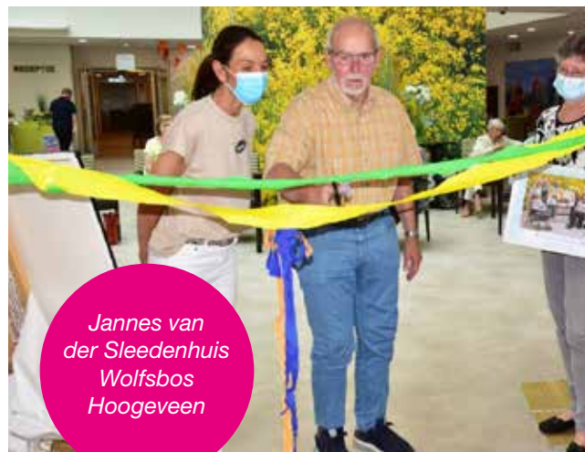
Jannes van der Sleedenhuis Wolfsbos Hoogeveen

De schildersclub van Wolfsbos (bestaande uit cliënten van Wolfsbos en bezoekers van dagbesteding de Boskamer) hebben een prachtige expositie feestelijk geopend in de hal van Jannes van der Sleedenhuis Wolfsbos. De expositie is dagelijks te bezichtigen, u bent van harte welkom!