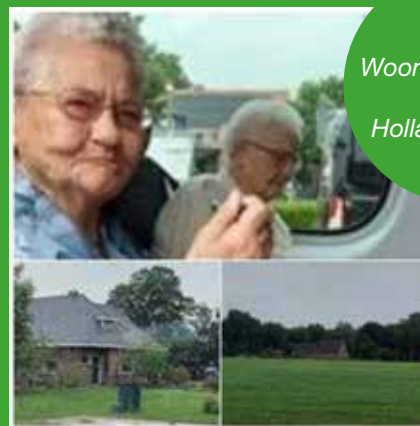
Woonzorgcentrum Beatrix Hollandscheveld

Samen met de bewoners reden we een rondje langs de huizen waar ze eerder gewoond hebben.