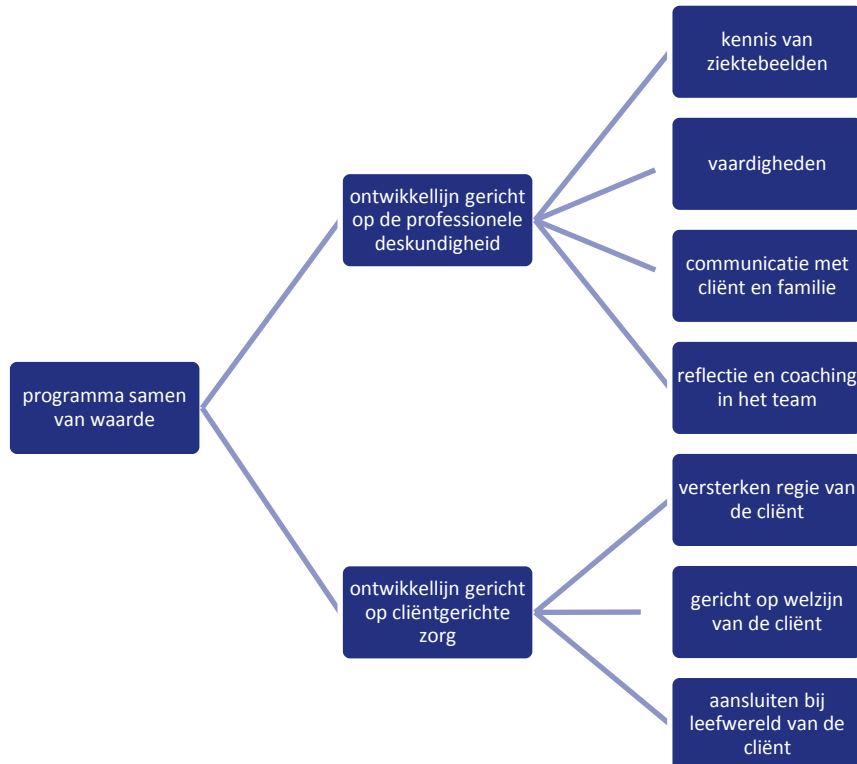
Figuur 1 Programma Samen van Waarde, deel 1

De opbouw van het programma was als volgt.